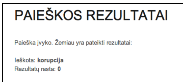
2 pav. Paieškos dėl žodžio „korupcija“ rezultatai.

Dažniausiai Lietuvos biudžetinės įstaigos interneto svetainėse teikia informaciją apie vykdomą korupcijos prevenciją, ataskaitas, atsakingus žmones ir pan. Įvedus VĮ „Regitra“ interneto svetainėje (laukelyje paieška ) žodį „korupcija“, rezultatų paieškos sistema nepateikė.